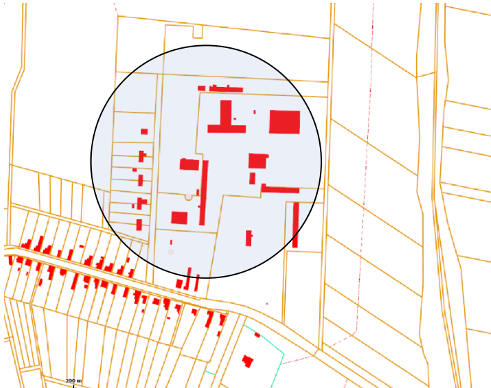
Helyszínrajz M= 1:5000