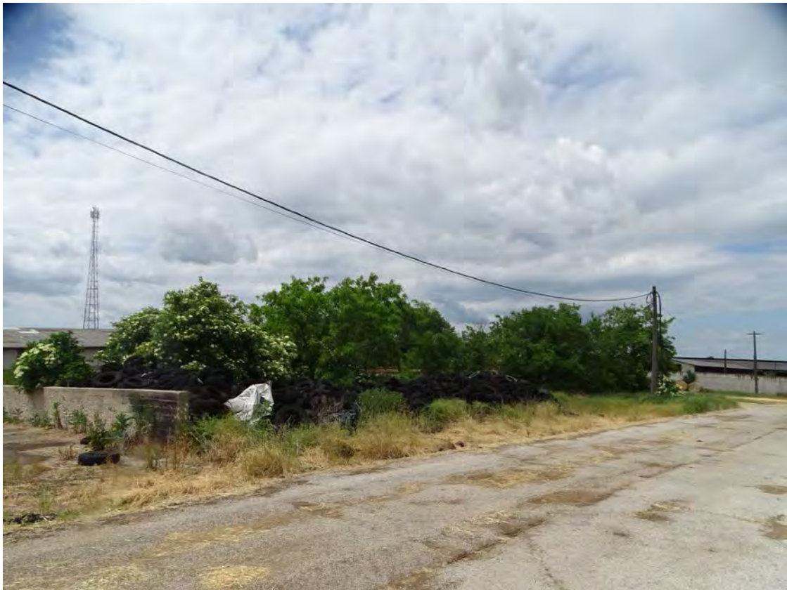
Akácos facsoportok, fekete bodzás cserjések gyomos száraz gyepen a trágyatárolóktól nyugatra