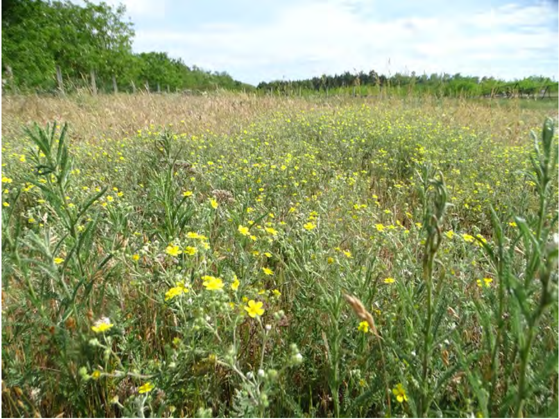
Kissé regenerálódottabb, ezüstpimpóban gazdag sztyepprétibb jellegű gyepek a telephely délkeleti csücskénél