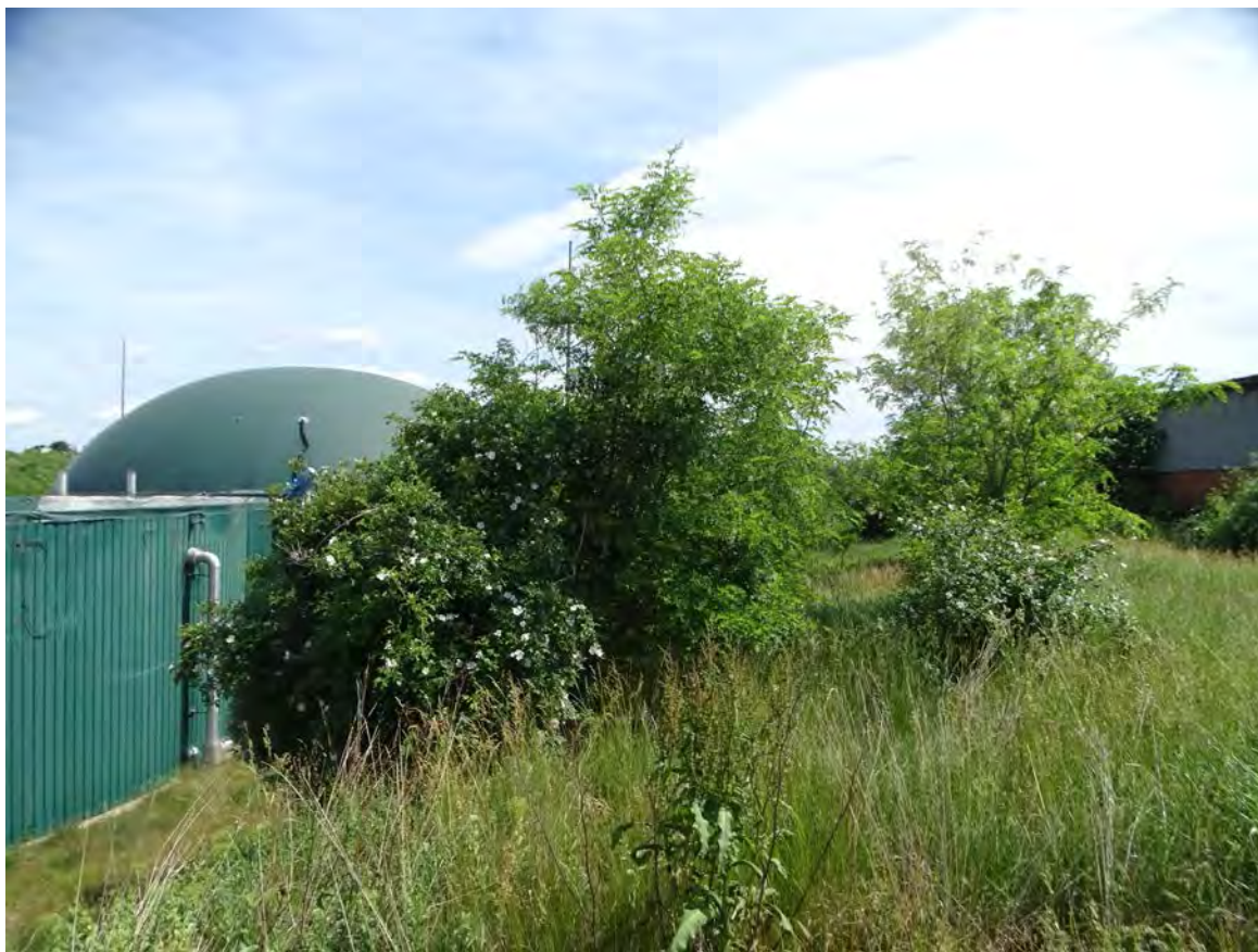
Akácos facsoportok, gyepűrózsás cserjések a biogázüzemet nyugatról határoló lejtőn