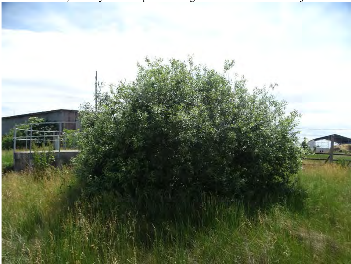
Kecskefűz a biogáz üzemet nyugatról határoló lejtő és a tőle nyugatra lévő karám közt