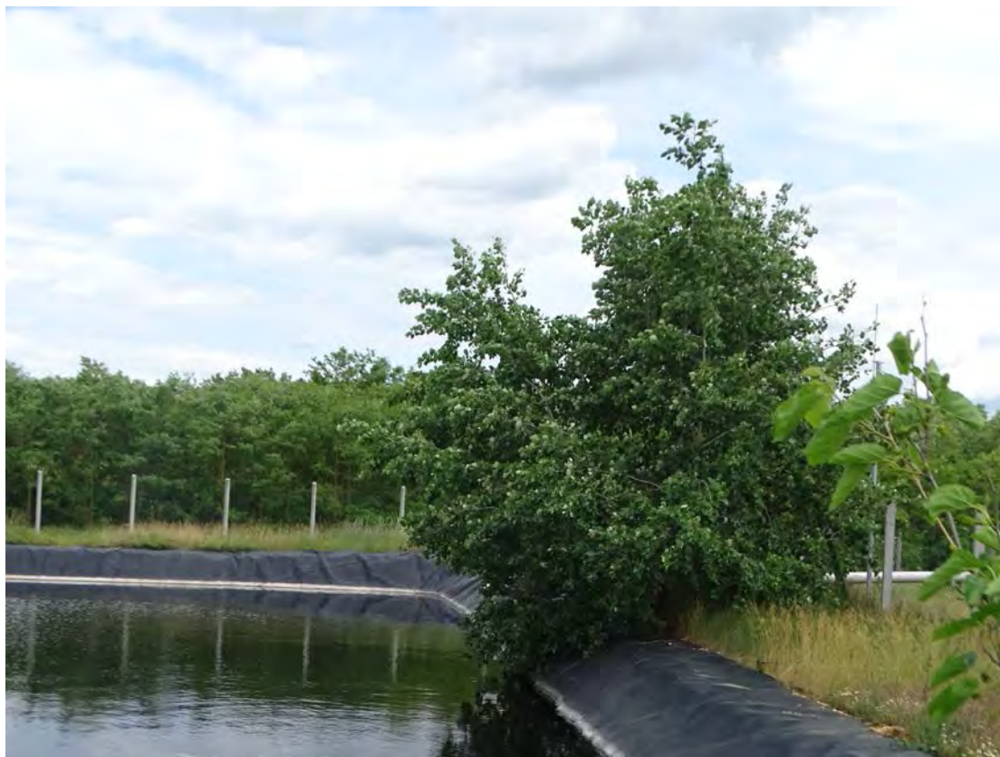
A telephely keleti részén lévő tározótó, déli részén fehér nyárral, háttérben a telephelyet keletről határoló 074/3 hrsz. 23/B erdőrészlet akácosa