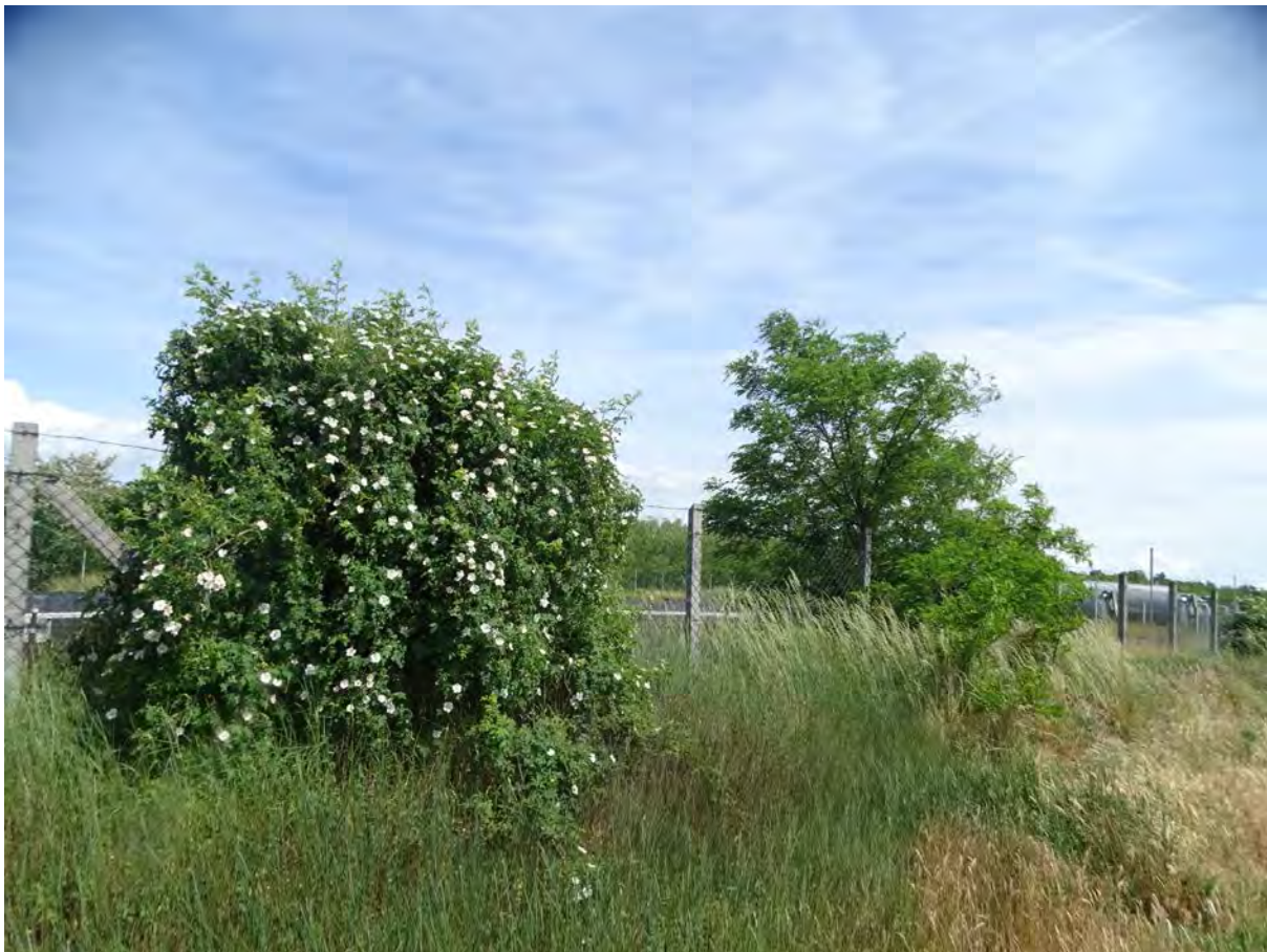
Elszórt akácok, gyepűrózsák a telephely keleti szélén lévő tározó nyugati szélén