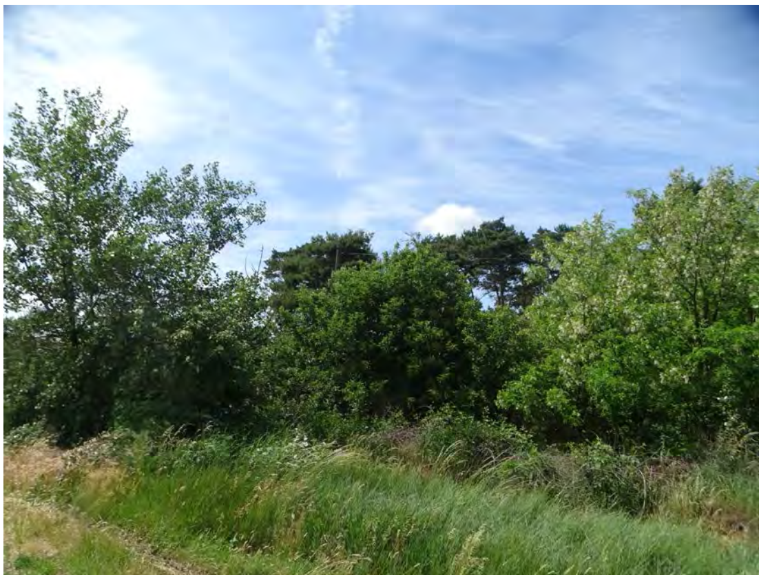
A telephelyet északkeletről határoló, akácos szegéllyel bíró 088/3 hrsz. 21/D erdei fenyves erdőrészte, a szegélyben rezgő nyárral