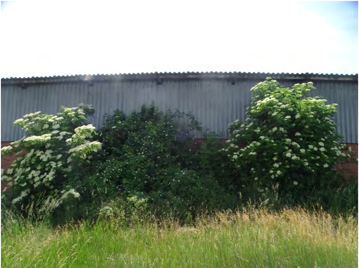
Fekete bodzás, gyepűrózsás cserjések a biogázüzemtől nyugatra lévő karám keleti szélén