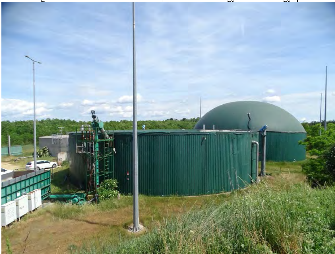
A biogázüzem és az azt övező gyomos száraz gyepek, elszórt fekete bodzák