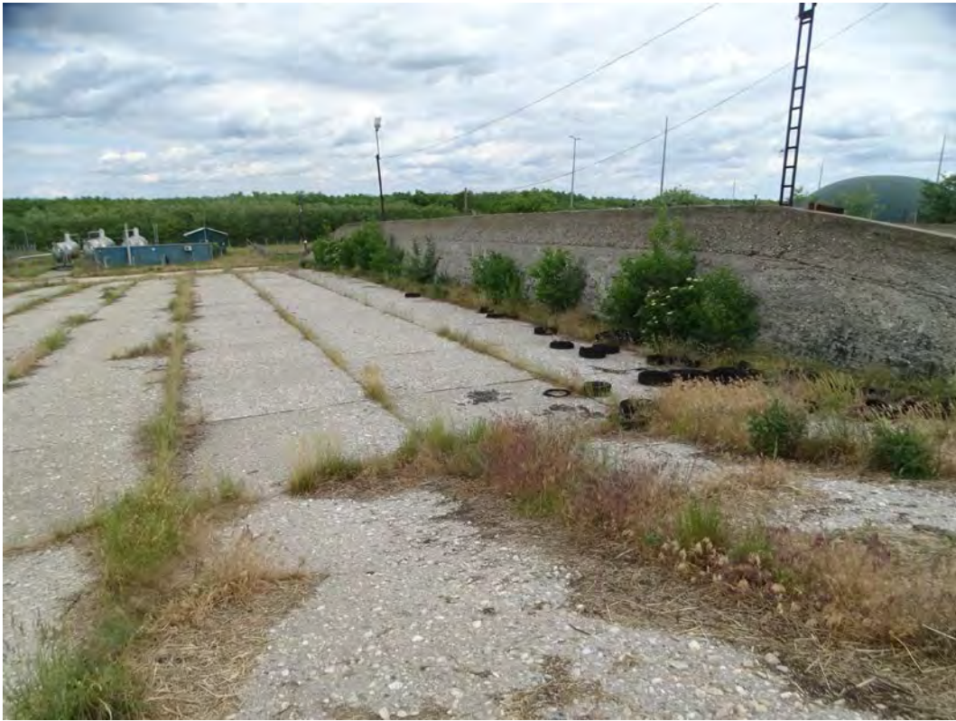
A trágyatároló kőlapjai közt felnőtt gyomos száraz gyepek a támfalnál fekete bodzás cserjék sarjaival