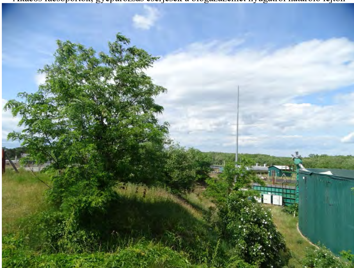
Akácos facsoportok, gyepűrózsás cserjések a biogázüzemet nyugatról határoló lejtőn