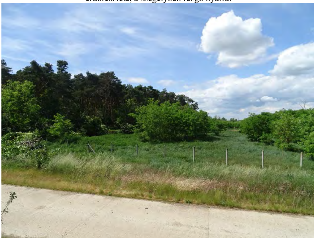
A telephelyet északkeletről határoló, akácos szegéllyel bíró 088/3 hrsz. 21/D erdei fenyves erdőrésztől keletre lévő gyomos száraz gyep, peremén akácos facsoportokkal, fekete bodzás, gyepűrózsás cserjésekkel