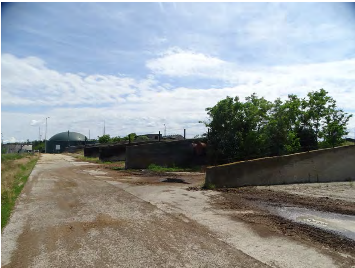
Akácos facsoport a délről számolt 5. trágyatároló északkeleti szélén a biogáz üzemhez bevezető út mentén