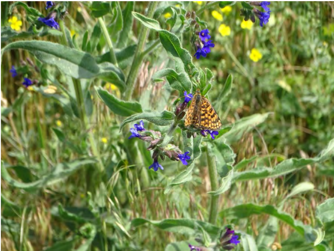
Kissé regenerálódottabb, sztyepprétibb jellegű gyepek a telephely délkeleti csücskénél orvosi atracéllal, rajta közönséges tarkalepkével