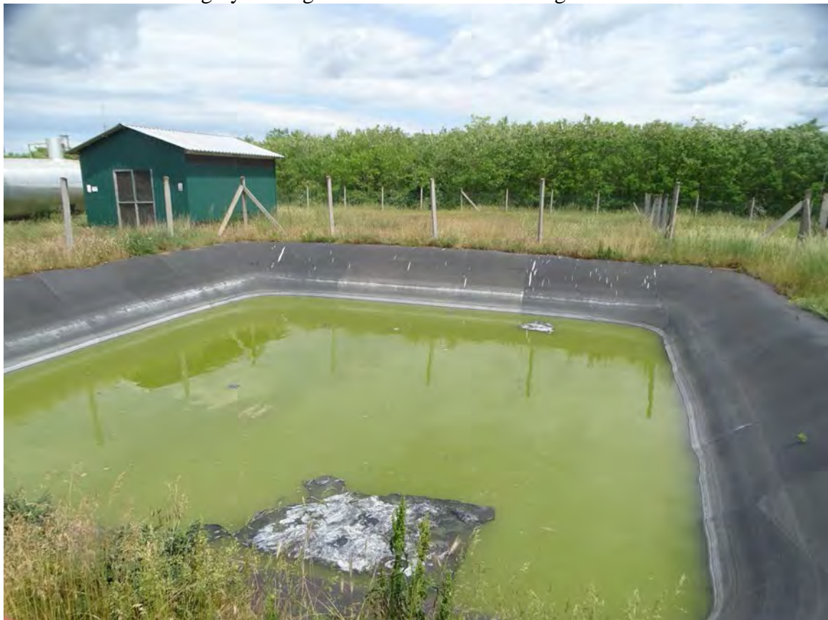
Tűzivíztó és a telephelyet keletről határoló 074/3 hrsz. 23/B erdőrészlet akácosa