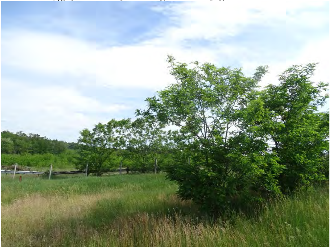
Akácos facsoport gyomos száraz gyepen, háttérben a levágott, de újrasarjadó, takarást jelentő 088/5 hrsz. 22/A erdőrészlete