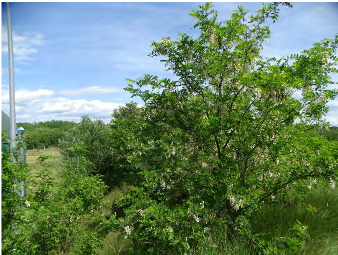
Akác, fehér nyaras facsoportok a biogázüzemet délről határoló lejtőn