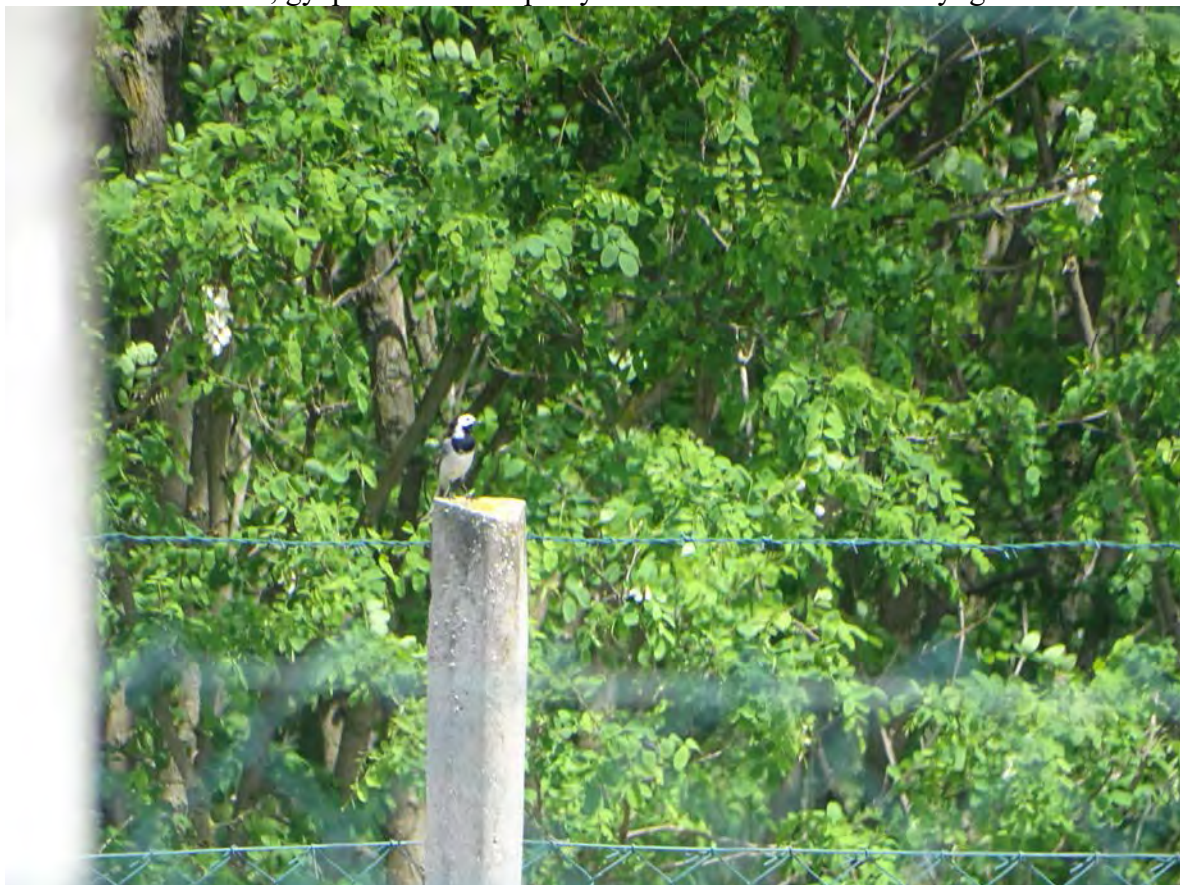
Barázdabillegető a telephely keleti szélét övező kerítésen a tározónál