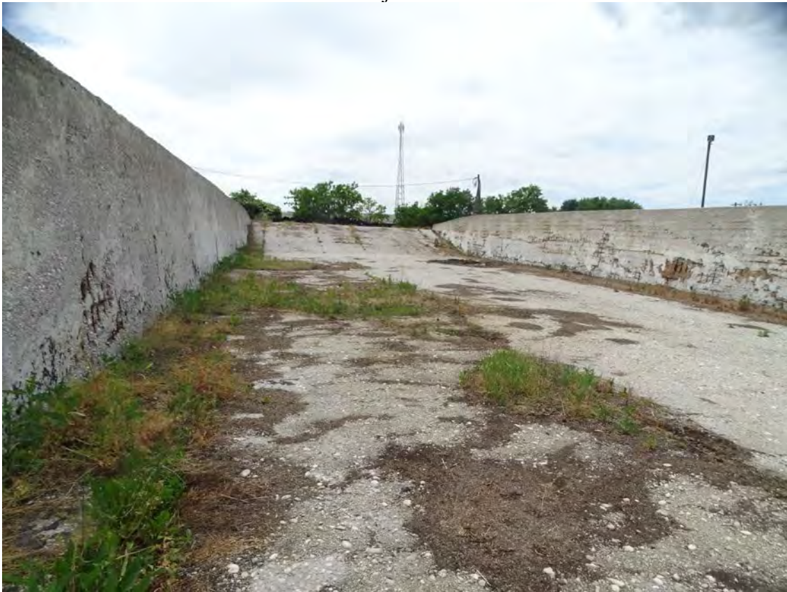
A délről számított harmadik trágyatároló és annak repedéseiben lévő gyomos száraz gyepek