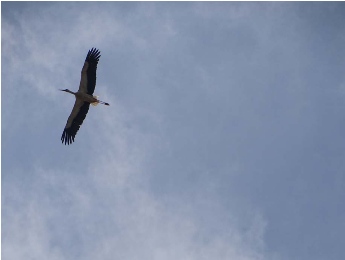
Fehér gólya a biogázüzem és annak mesterséges tavai felett