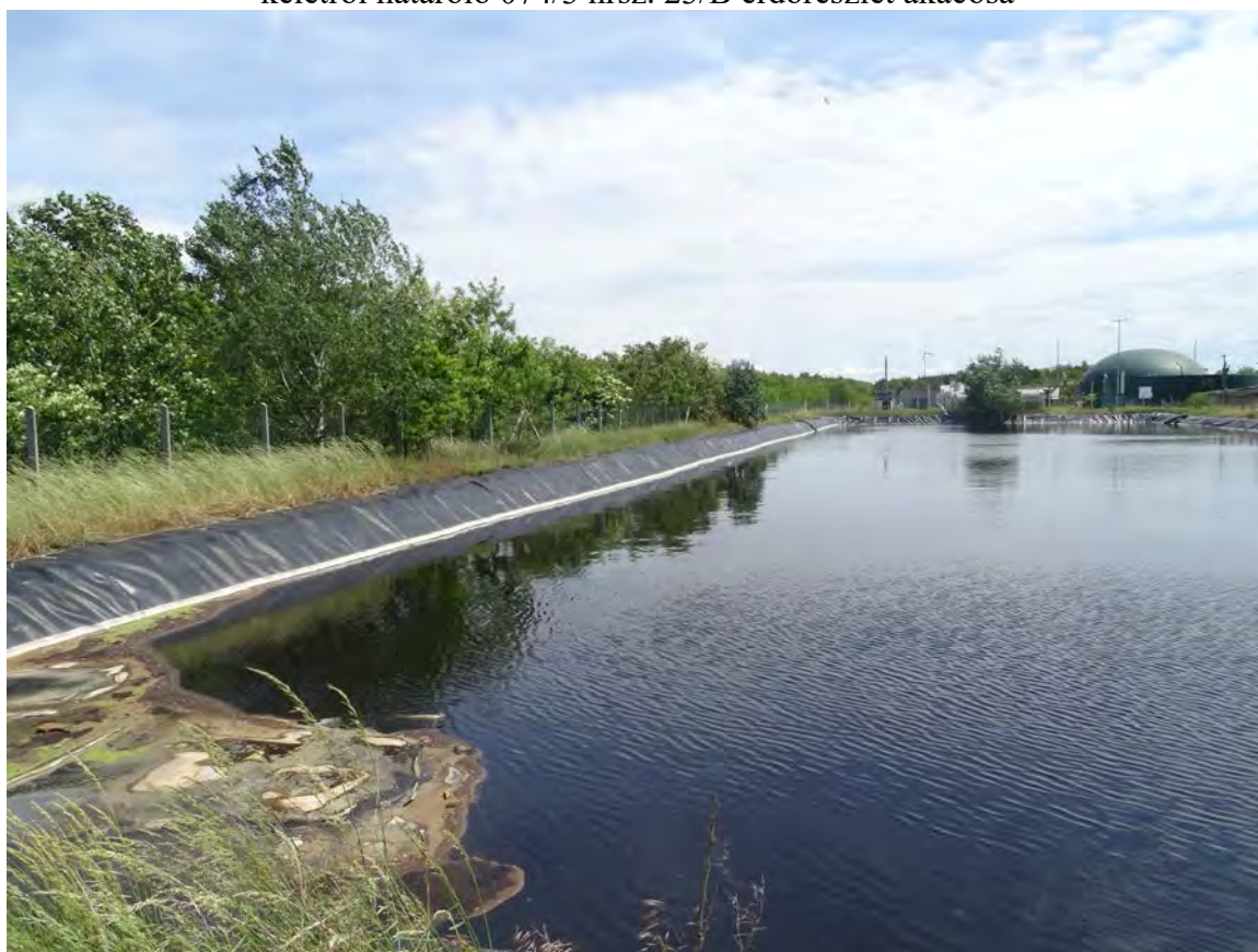
A telephely keleti szélén lévő tározó, keleti szélén akác, rezgő nyaras facsoportokkal, fekete bodzás cserjésekkel