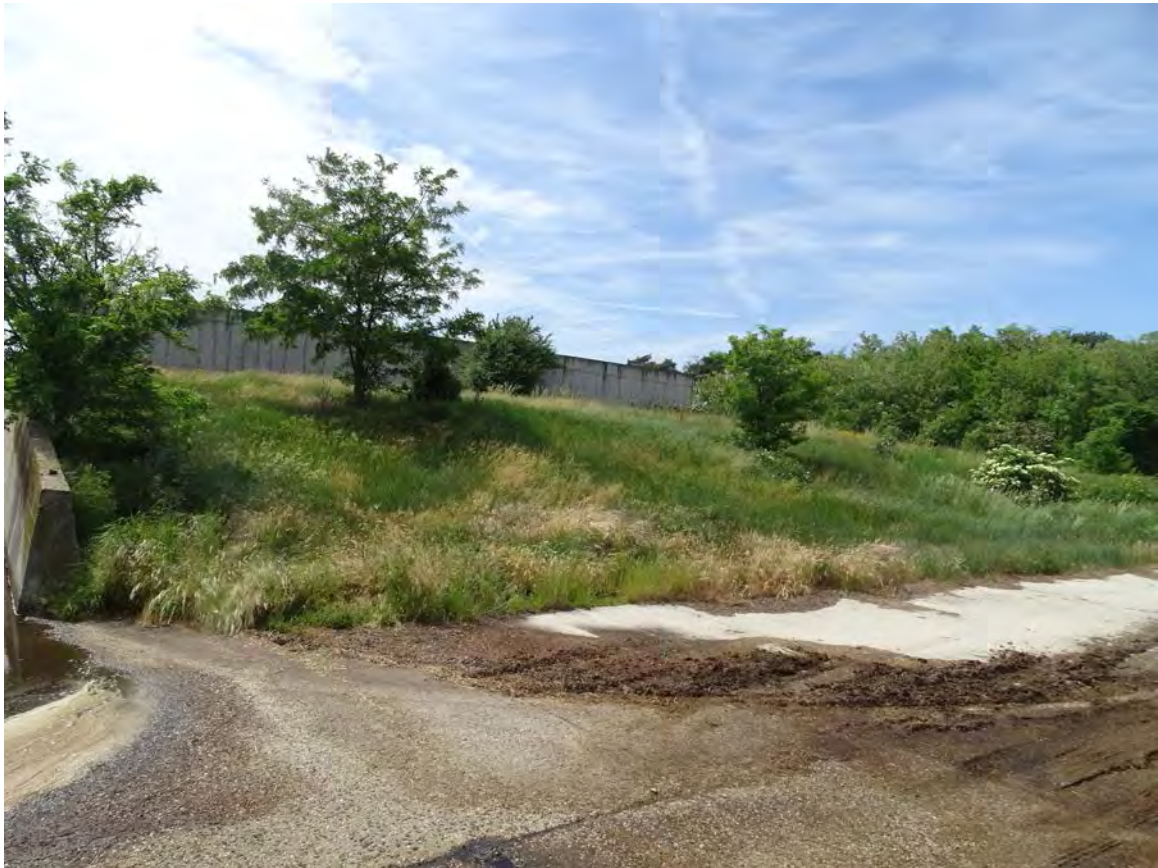
Gyomos száraz gyep gyepűrózsával, fekete bodzával akáccal a trágyatárolók északkeleti csücskénél